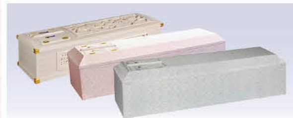
桐三面彫刻棺orペーズリーピンクor白