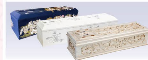
総檜五面彫刻棺or花紺or彩花