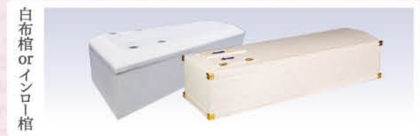
白布棺 or インロー棺