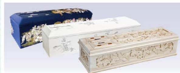
総檜五面彫刻棺or花紺or彩花