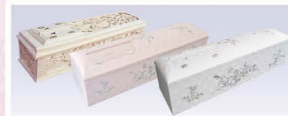
桐五面彫刻棺or花刺繍白or花刺繍ピンク