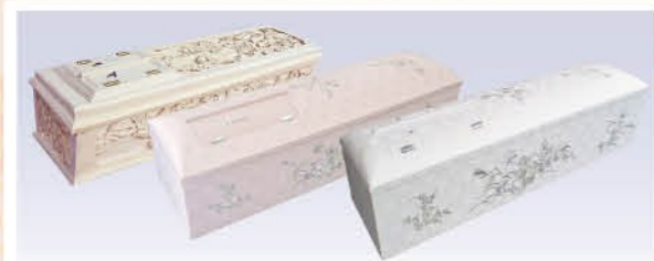
桐五面彫刻棺or花刺繍白or花刺繍ピンク