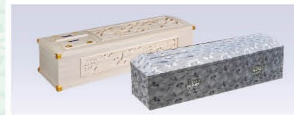
桐三面彫刻棺orソピア