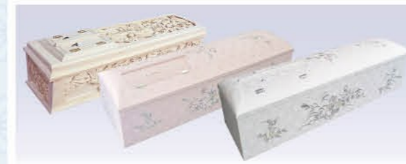
桐五面彫刻棺or花刺繍白or花刺繍ピンク